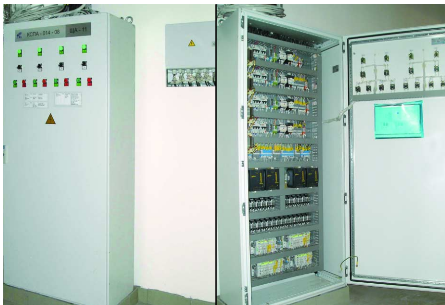
Рис. 2. Шкаф системы управления вентиляционной установкой

мой температурой) и снижением затрат (достижением необходимой температуры с минимальным расходом энергии).